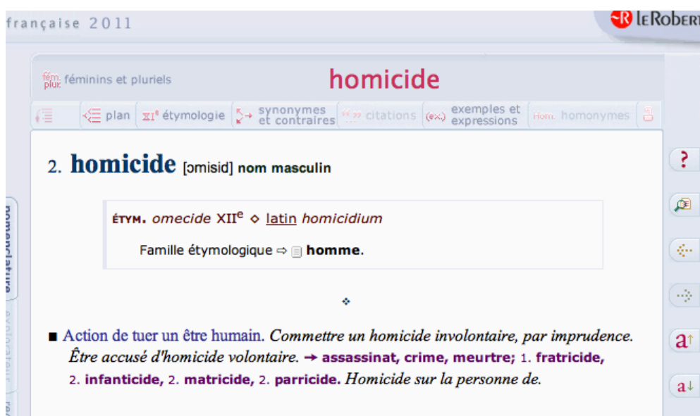
Figura 2 - Homicide - Petit Robert de la Langue Française