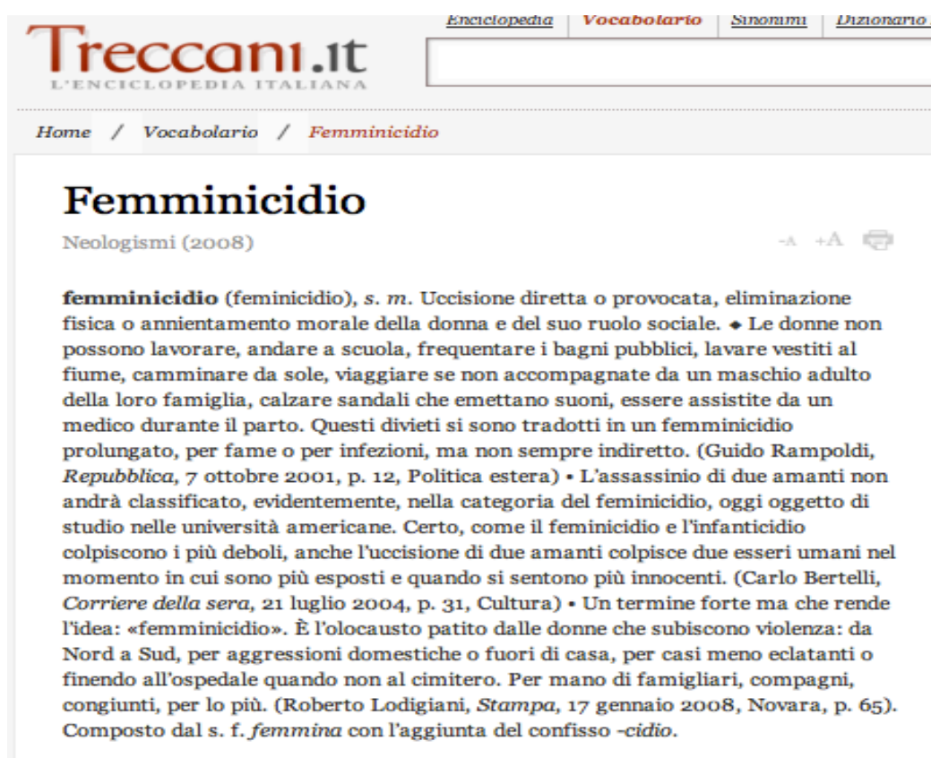
Figura 4 - Femminicidio - Enciclopedia Treccani Online

Infine, la definizione proposta dall' Enciclopedia Treccani , oltre a presentare la data di coniazione del neologismo (attestato in questo caso dal 2008) e una breve nota informativa sulla derivazione del vocabolo femminicidio , è anche corredata di numerose citazioni di fonti autorevoli in cui la parola è stata impiegata, con le relative date di utilizzo e/o pubblicazione (Figura 4).