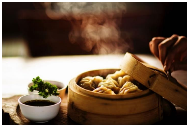
Figura 4: Ravioli cinesi cotti al vapore serviti nel cestello di bambù

Zheng è un metodo di cottura originario della cucina cinese. Gli ingredienti conditi vengono disposti su un cestello di bambù che a sua volta viene inserito in una vaporiera. La cottura a vapore permette di assaporare la tenerezza e la freschezza degli alimenti mantenendo allo stesso tempo il gusto, la forma e le proprietà nutritive originali.