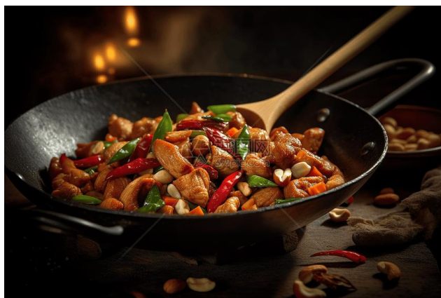
Figura 1: Pollo Gong Bao su padella wok

Chao è il metodo di cottura più caratteristico della cucina cinese. Questa tecnica consiste nel saltare gli ingredienti, tagliati a piccoli pezzi, per qualche minuto a fuoco medio-alto. Prima si riscalda la padella wok , poi si fa scorrere una piccola quantità d'olio su tutta la sua superficie. Si fanno soffriggere gli aromi come zenzero, cipolla e aglio, seguiti dagli ingredienti principali, che devono essere aggiunti in successione a partire da quello che impiega più tempo per cuocere. A cottura quasi ultimata si possono aggiungere i condimenti, quali salsa di soia, sale, zucchero, vino e aceto. Il piatto va servito e gustato immediatamente.