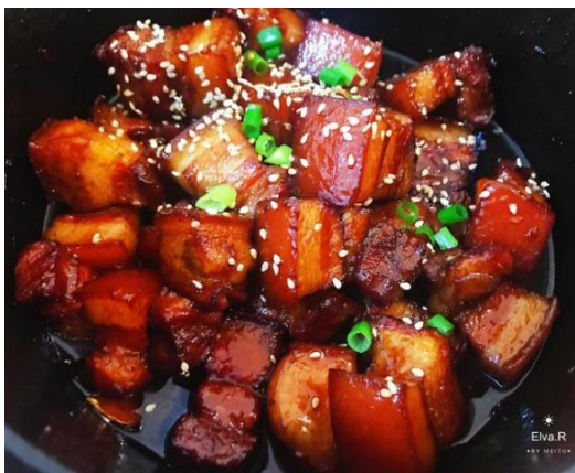
Figura 2: Maiale brasato in salsa di soia

La tecnica shao prevede una prima cottura degli ingredienti, che possono essere fritti, bolliti o saltati in padella. Dopodiché vengono conditi, vi si aggiunge brodo o acqua e si fa cuocere a fiamma bassa. Si può terminare la cottura a fuoco vivo per facilitare l'assorbimento di tutto il liquido. Esistono diversi tipi di cottura shao a seconda delle salse, delle spezie e dei condimenti utilizzati. Ad esempio, la cottura hongshao prevede la brasatura nella salsa di soia.