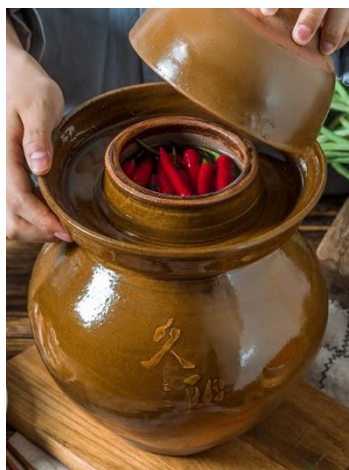
Figura 6: Giara di terracotta in cui si fanno fermentare le verdure