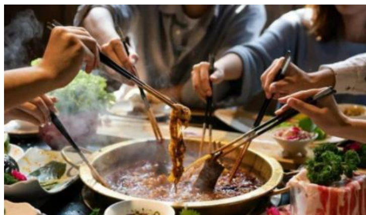
Figura 5: Cuocere la carne nell'hot pot, un momento conviviale

Shuan è una tecnica molto particolare che indica l'azione di cuocere la carne nell' hot pot cinese. Si afferra la sottile fettina con le bacchette e si “sciacqua” nel brodo bollente, dopo qualche secondo sarà pronta per essere gustata.