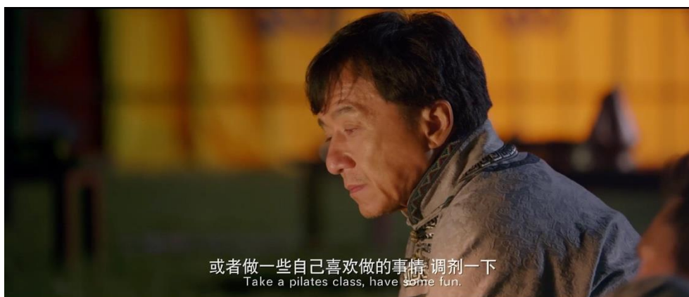
Figura 1: Scena dal film di produzione sino-americana Skiptrace - Missione Hong Kong

I sottotitoli interlinguistici forniscono un servizio di sottotitolazione in una lingua diversa da quella del prodotto originale. Presentano rispetto ad altre forme di traduzione una serie di sfide maggiori dato che, contemporaneamente, prevedono sia il passaggio dalla lingua di partenza (SL) alla lingua di arrivo (TL) sia il trasferimento della comunicazione dal codice orale a quello scritto ( ibid. : 61).