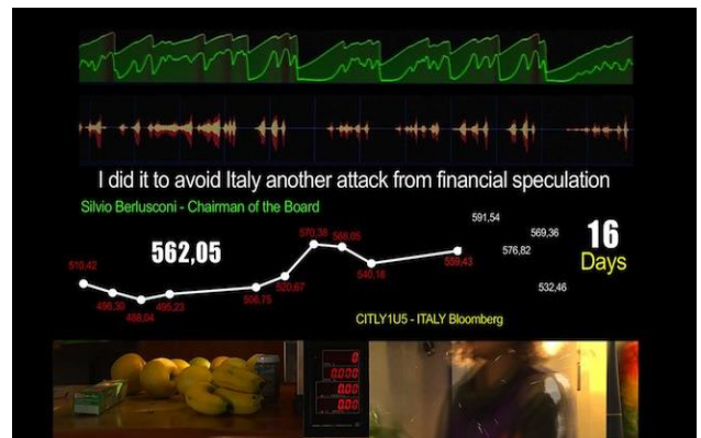
Marcantonio Lunardi, Last 21 days 2011