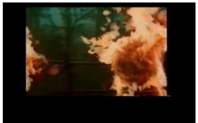
Canecapovolto, Impero/ In God We Trust 2004