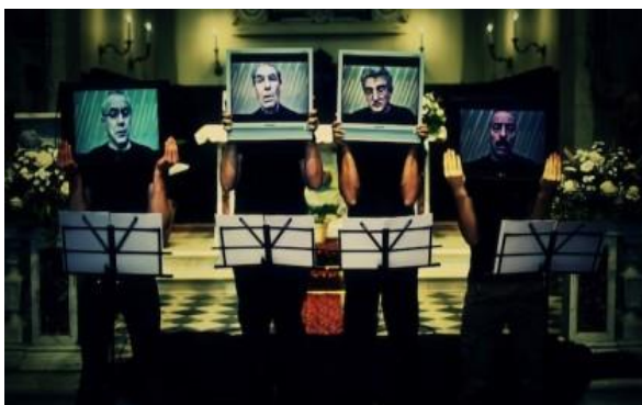
Marcantonio Lunardi, The Choir 2013