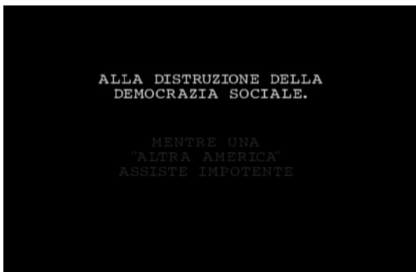
Canecapovolto, Impero/ In God We Trust 2004