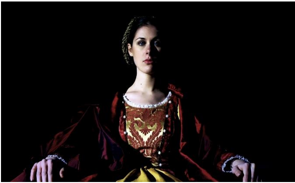
Marcantonio Lunardi, The Idol 2015