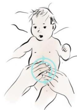
SOLE E LUNA

Con il bambino davanti a te, massaggia il lato sinistro del suo addome, a livello del colon discendente, dall'alto verso il basso (come la lettera I), poi orizzontalmente dal suo lato destro verso il suo lato sinistro e quindi dall'alto verso il basso (come una L rovesciata) e quindi con movimento semicircolare in senso orario, sempre partendo dal suo lato destro verso il suo lato sinistro, salendo dal basso verso l'alto, passando sopra l'ombelico e quindi scendendo dall'alto verso il basso (come una U capovolta). Durante il massaggio puoi ripetere dolcemente le parole I love you.